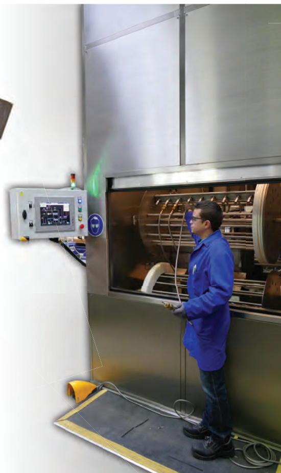
Centre de nettoyage O 2 / O 2 cleaning unit