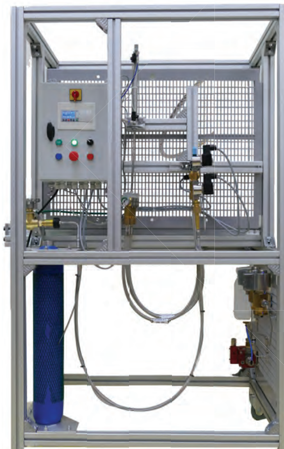
Test de cyclage / Cycle test